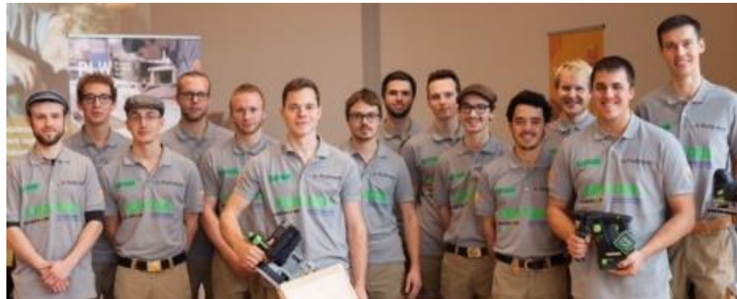
Sechster von rechts